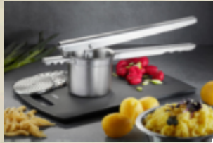
Kartoffel-, Saft- und Spätzlepresse „PRENSO“